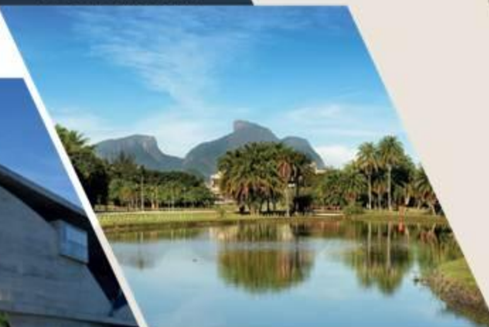
BOSQUE DA BARRA