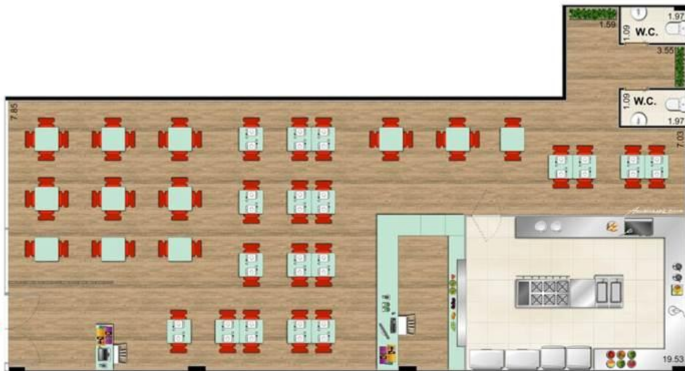
SUGESTÃO - RESTAURANTE