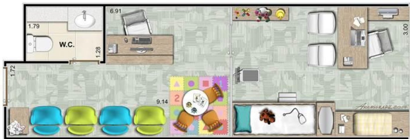
SUGESTÃO - PEDIATRA

Colunas 25, 26, 29, 30, 32, 33, 36, 37, 63, 64, 67, 68, 70, 71, 74 e 75