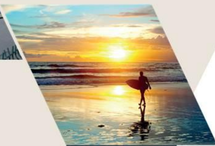
PRAIA DA BARRA

Mais do que opções de compras e lazer, aqui você encontrará verdadeiros pontos turísticos ao seu redor.