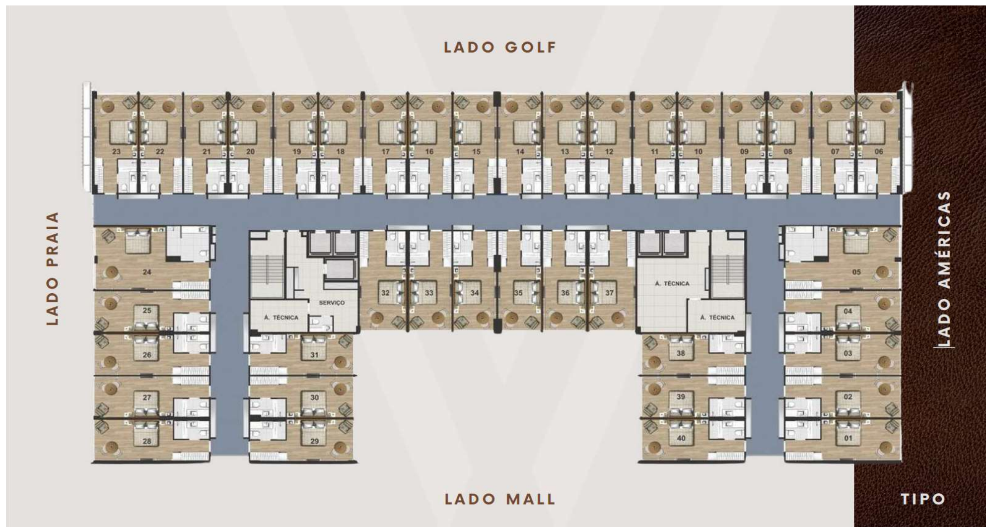
PLANTA DAS SUÍTES DO 1º AO 4º ANDAR